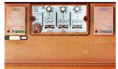
Relais de protection RAH 411 E